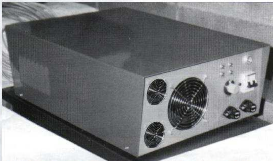
FIG. 2 - NUOVO GENERATORE TRIFASE A MICROPROCESSORE TIPO "ULTRASUONI PIEZO 20.000" CON UNA POTENZA EFFICACE DI 20KW A FREQUENZE DA 18.000 A 45.000 HZ (18/45 KHZ)

"In effetti - spiega Puddu - ogni Fonderia esprime casi analoghi, quali lo stampaggio e la fusione di particolari di precisione per l'automobile, i casalinghi, la meccanica, ... ma ogni singola officina denota molte diversità nell'utilizzo dei