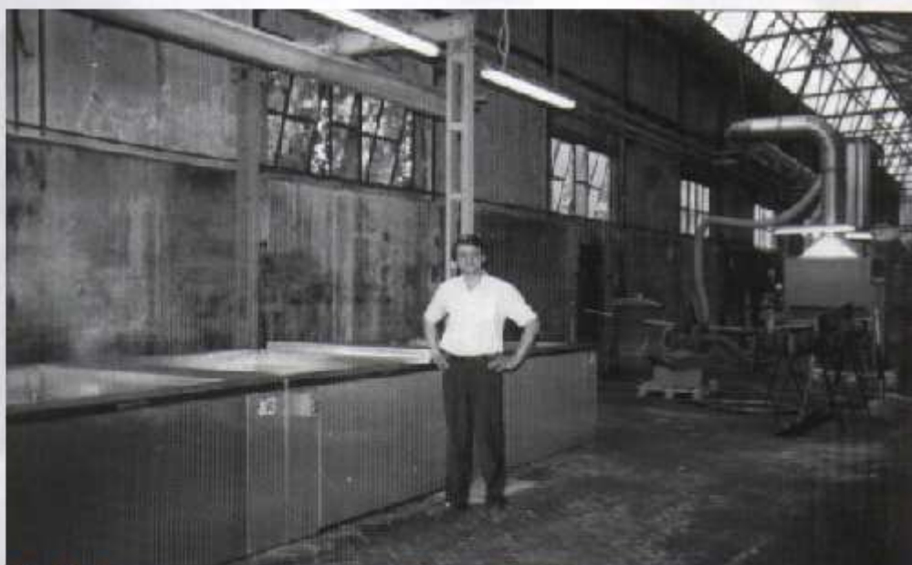
FIG. 1 - TIPICO IMPIANTO ULTRASUONI I.E. TIPO US 2000-IMSO COMPOSTO DA: LAVAGGIO CALDO CON ULTRASUONI, RISCIAQUO IDROGINETICO, PROTEZIONE CON ASCIUGATURA FINALE

Con una macchina Ultrasuoni I.E. è possibile lavare e pulire perfettamente in pochi minuti lo stampo in acciaio e in brevi istanti ogni tipologia di particolare meccanico, sia questo in lega pressofusa che in acciaio, ghisa, acciaio inox, metallo speciale: il gruppo elettronico generatore - trasduttore generando una vibrazione molecolare ad alta frequenza nel fluido detergente, pulisce istantaneamente ogni superficie me-